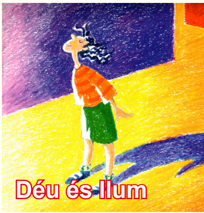
Déu és llum

Tots tenim una mica de por de la foscor, perquè no veiem què o qui està al nostre costat, no sabem on anar, quin és la direcció justa. Déu és com la llum, perquè ens ajuda a comprendre el que és bo i ens indica quin camí hem de seguir. Saber que Déu és a prop nostre és com estar amb una llum enmig de la foscor: ja no es té por.