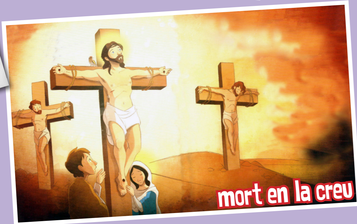
mort en la creu