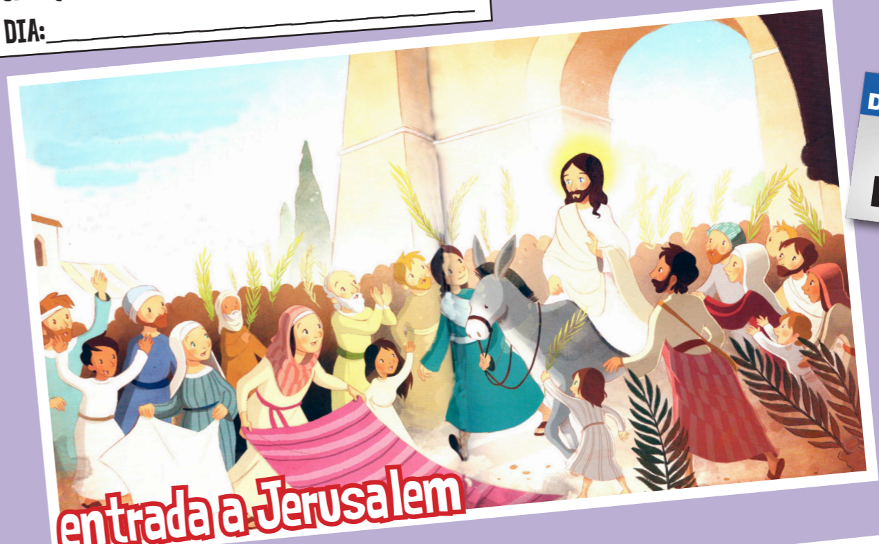
entrada a Jerusalem