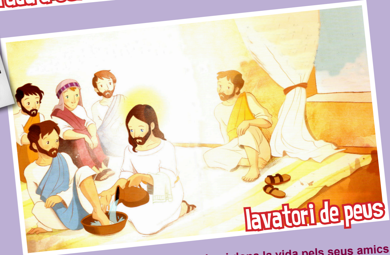
lavatori de peus