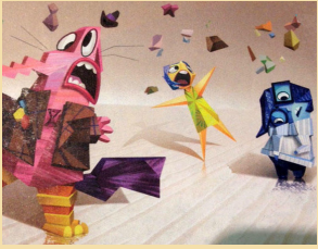
EL PENSAMENT ABSTRACTE