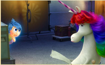
ELS SOMNIS PRODUCCIONS