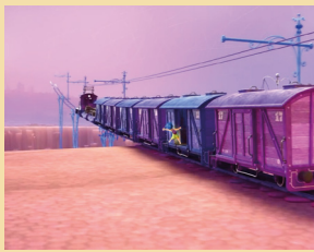
EL TREN DEL PENSAMENT