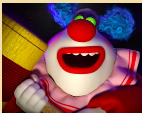
EL SUBCONSCIENT LES PORS-MALSONS

✓ Què és el que t'ha impressionat més de la pel·lícula