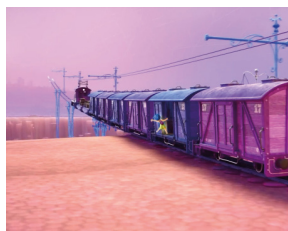
EL TREN DEL PENSAMENT