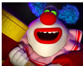
EL SUBCONSCIENT LES PORS-MALSONS