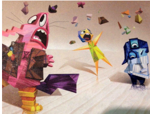
EL PENSAMENT ABSTRACTE