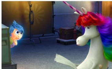
ELS SOMNIS PRODUCCIONS